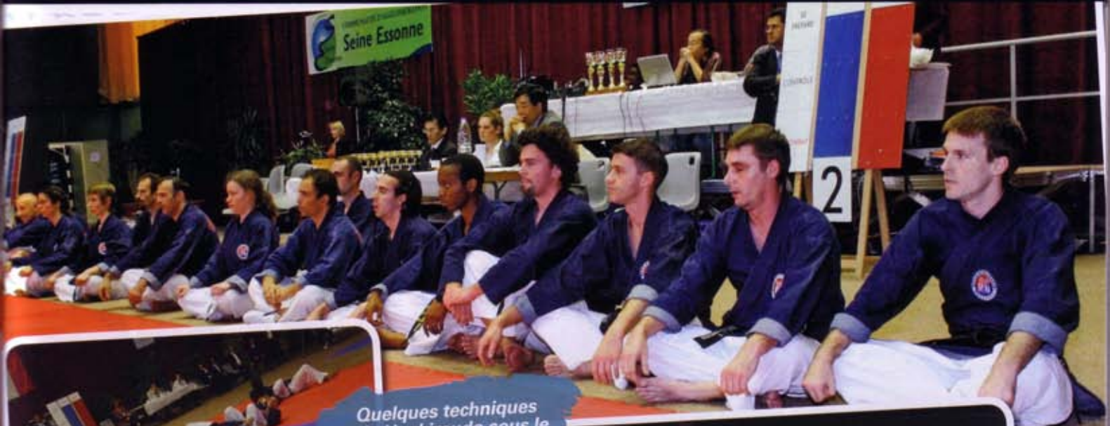
Quelques techniques de Hapkimudo sous le regard de gradés.