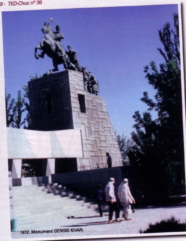
1972. Monument GENESIS KHAN.