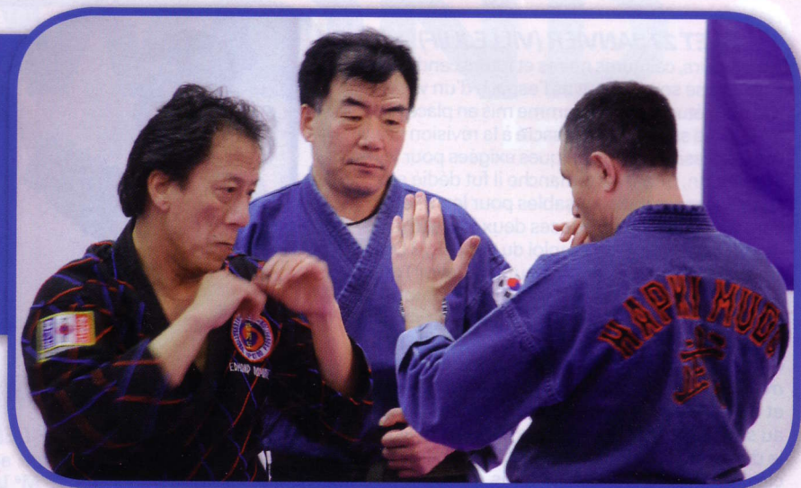
Sous le regard du Maître, les gradés répètent inlassablement.